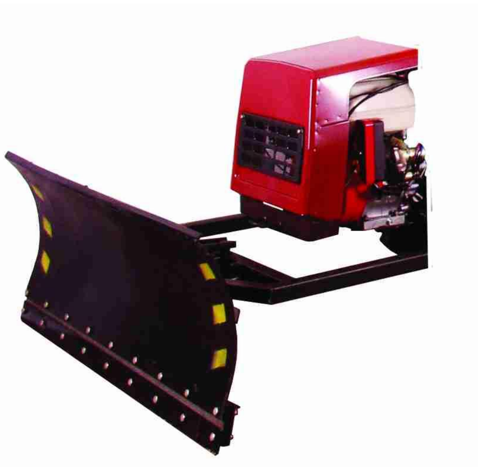
Оборудование бульдозерное ОБ12

В связи с постоянным совершенствованием изделия возможны незначительные изменения в конструкции отдельных сборочных единиц, не отраженные в настоящем издании и не являющиеся основанием для претензий.